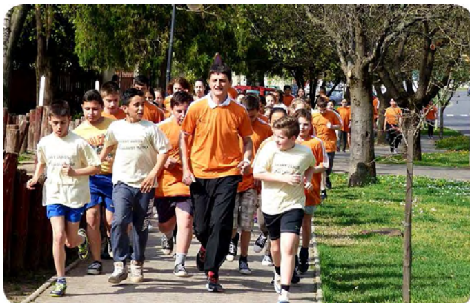
A „Nárcisz futás” résztvevői