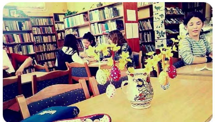
Izgalmas verseny a Víz világnapján

„A debreceni AKSD szeméttelpe, a debreceni repülőtér közelében, lakott területtől távol, a város legszélén található. A telephelyre hordják be a speciális szállító járművek a kommunális szelektív hulladékot. A kommunális szemetet a vállalat válogatás után bedepózza. A bedepózott hulladékból biogázt nyernek, melyet továbbalakítanak villamos energiává. A szelektív hulladék a telephelyen válogatás és osztályozás után bálázásra kerül, mely innentől elveszti szemét funkcióját, és ott alakul másodlagos nyersanyaggá. Ezzel a hulladékgyűjtési móddal az emberek kímélik a környezetet. Látogatásunk során láthattunk több száz és ezer kilogrammos másodlagos nyersanyagbálákat, amiket kamionokkal hordanak el az újrahasznosító gyárba. Látogatásunk során még inkább meggyőződünk arról, hogy érdemes különválogatni a szemetünket, mert megmenthetünk rengeteg anyagot, amit újra felhasználhatnak. Azáltal, hogy a papírt különválogatjuk, rengeteg fát megóvhatunk a kivágástól, és nem terheljük a talajunkat a nehezen lebomló anyagokkal, melyekből a kiszívargó vegyszerek károsítják a talajt és az ivóvizünket.”