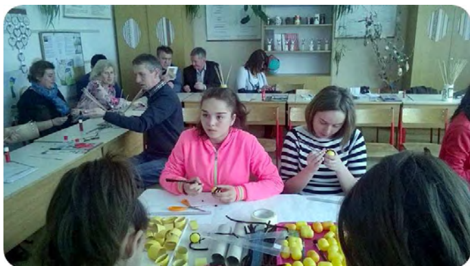
Újrahasznosítás közös munkával