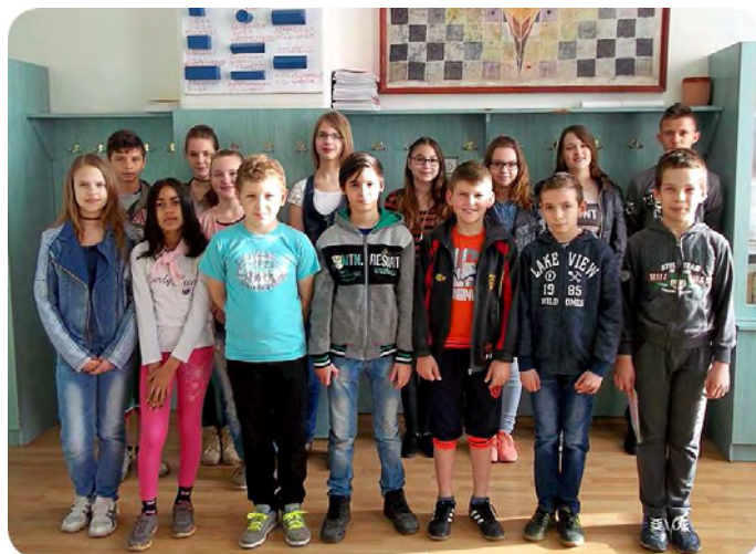
Az alapműveleti verseny legjobbjai

2016. április 06. Az alapműveleti matematika verseny körzeti fordulójának szervezését immár több mint tíz éve bonyolítja iskolánk. Minden évben igen szép eredmények születtek. Az idén sem lehet okunk panaszra, ugyanis minden évfolyamon van nyertes gyerekünk. Gratulálunk nekik és felkészítőiknek.