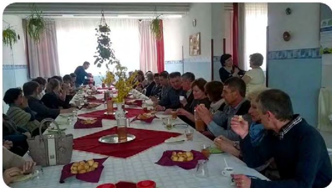
A plenáris ülés résztvevői