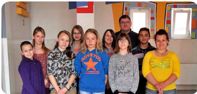
Bejutottak a megyei rajzverseny második fordulójába

A versenynek a debreceni Kós Károly Művészeti Szakközépiskola és Kollégium adott otthont. A második fordulóban irodalmi művek illusztrációja volt a feladat, szabadon választott technikával, A/4-A/3-as méretben. A Létavértesi Arany János Általános Iskolából 9 tanuló pályázott és - nagy örömeinkre - mind a 9 tanulónkat beaválogatta a zsűri a 2016. április 9-ei második fordulóra.